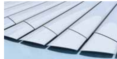
Escalier finition lisse Lames à ailettes recoupées