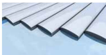
Escalier finition équerre

Ailettes brosses PVC permet de réduire l'espace entre le tablier et le bord du bassin