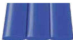
Bleu / Noir