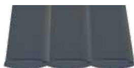
Gris anthracite / Noir