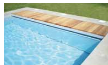
Cloison de séparation