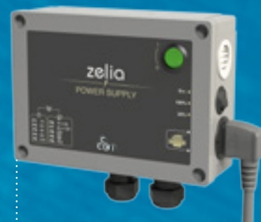
Coffret d'alimentation Power supply