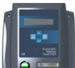
Pilotage facile de l'électrolyseur Easy control of salt chlorinator