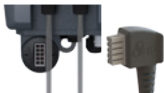
Raccordement facile de la cellule Easy connection to control panel